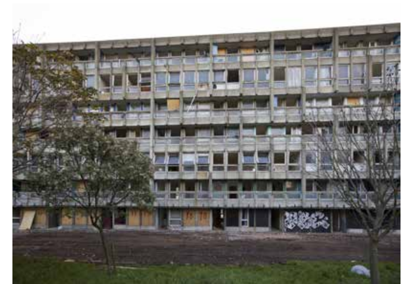
Robin Hood Gardens, completed 1972, designed by Alison and Peter Smithson