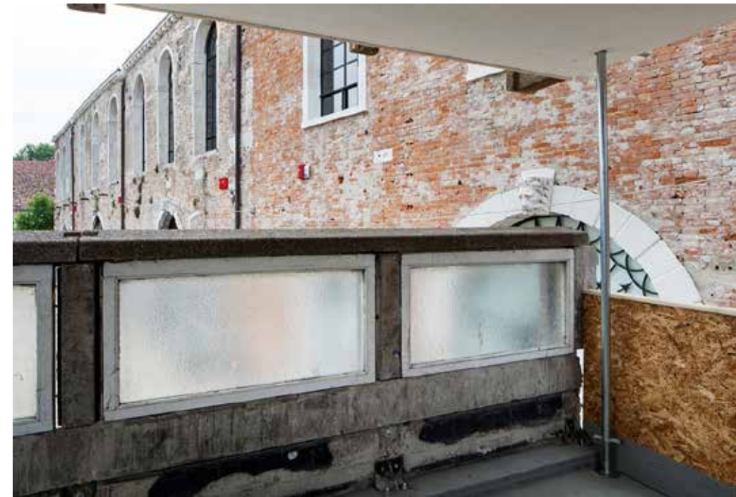
Video Installazione dell'artista Do Ho Suh, Padiglione delle Arti Applicate, La Biennale di Venezia, 2018(c)

utopia and of a political effort, but also as a shelter for many people, a refuge even if with a too short life. A fragile architecture, a ruin in reverse.