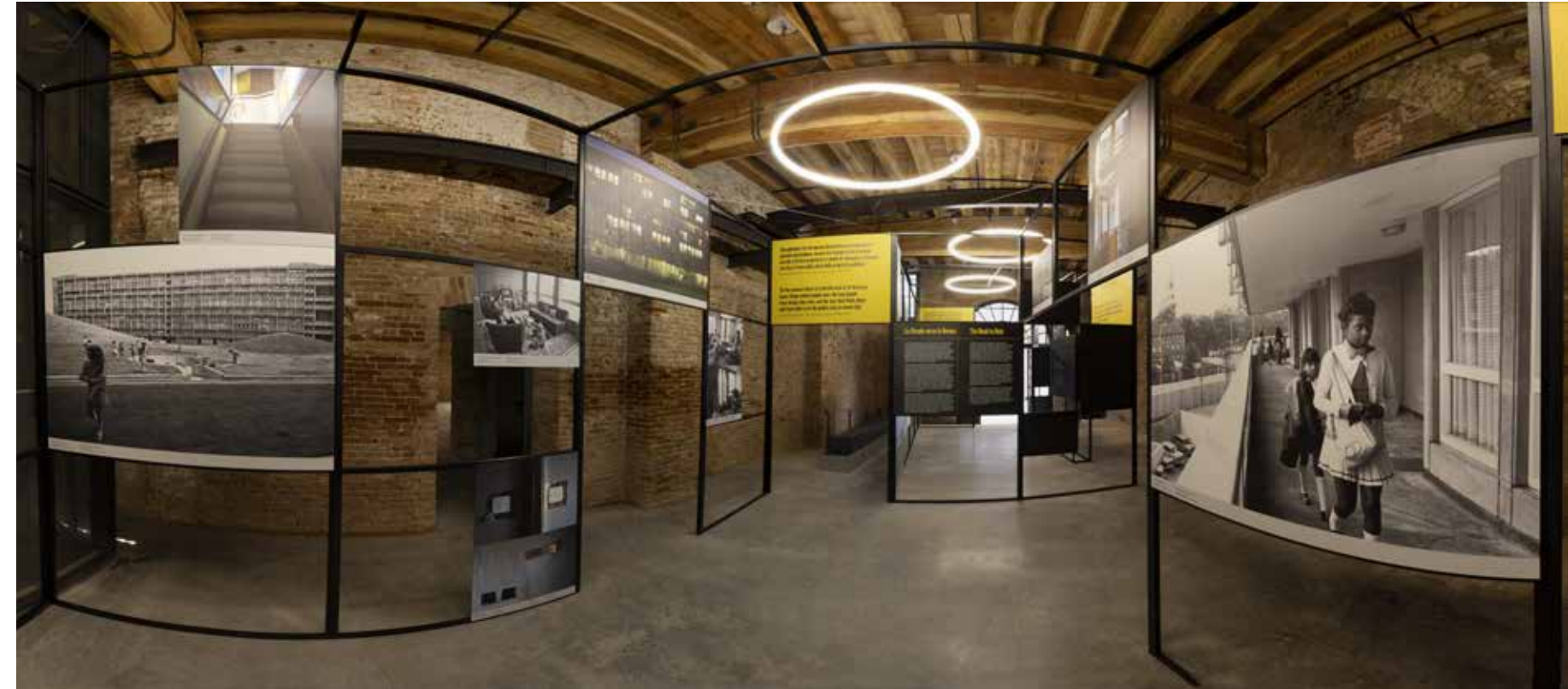
Robin Hood Gardens: A ruin in reverse, Padiglione delle Arti Applicate, La Biennale di Venezia, 2018

le sue operazioni che interrogano il significato della casa e dell'abitare e si propone con i suoi interventi di catturare i ricordi del vissuto umano di cui le abitazioni portano l'impronta. Per il V&A realizza una monumentale installazione composta da un film/animazione che documenta le fasi di demolizione del Robin Hood Gardens. Un lavoro che si avvale di tecnologie per scansione 3D e fotogrammetria e di una proiezione su uno schermo largo 13 metri. La videocamera seziona il palazzo con un fare chirurgico quasi a ricordare l'autopsia su un corpo. Rivela scorci di vita individuale, frammenti di interni domestici, sovrapponendo il luogo pubblico al privato, la vita alla memoria. Attraverso questo lungo corridoio di immagini si ritrova l'aspetto umano dello spazio architettonico, non solo di un edificio ricordato per il suo essere simbolo di uno stile, di un'utopia e di una battaglia politica, ma anche come un luogo che per molti è stato, soprattutto, un rifugio sebbene dalla vita troppo breve. Un'architettura fragile, una rovina al contrario.