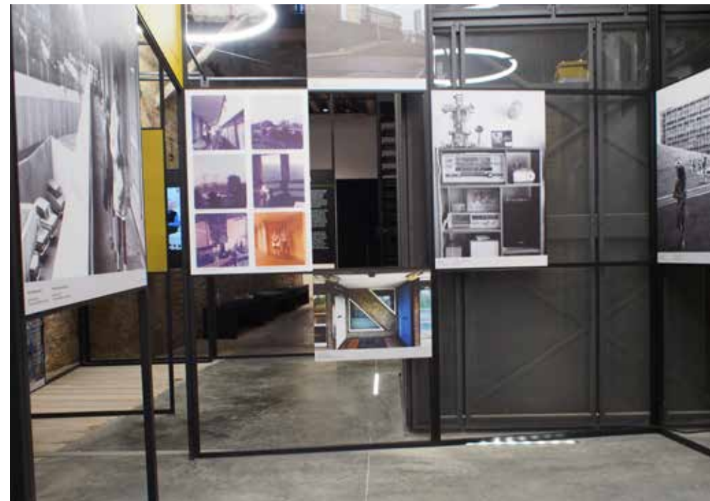
Picture of the project on the grids inside the Pavilion