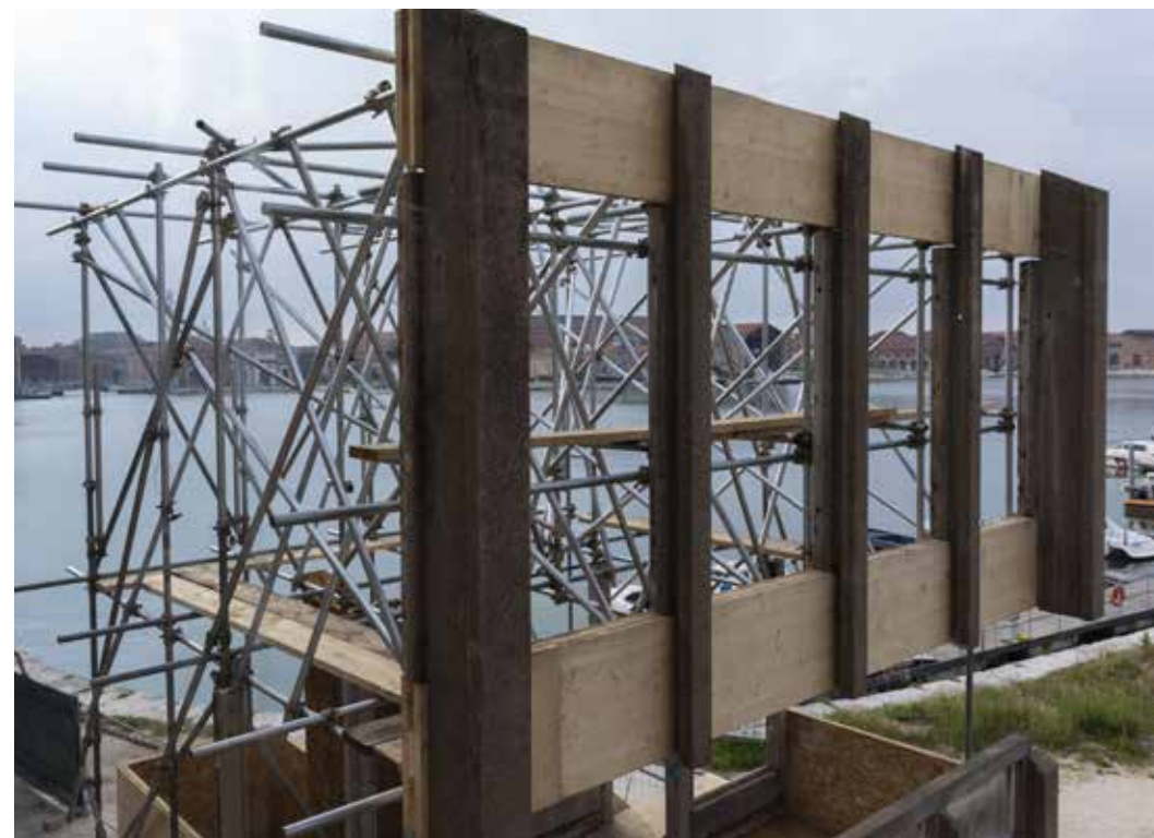
Upper storey of the fragment of Robin Hood Gardens, Pavilion of Applied Arts, La Biennale di Venezia, 2018