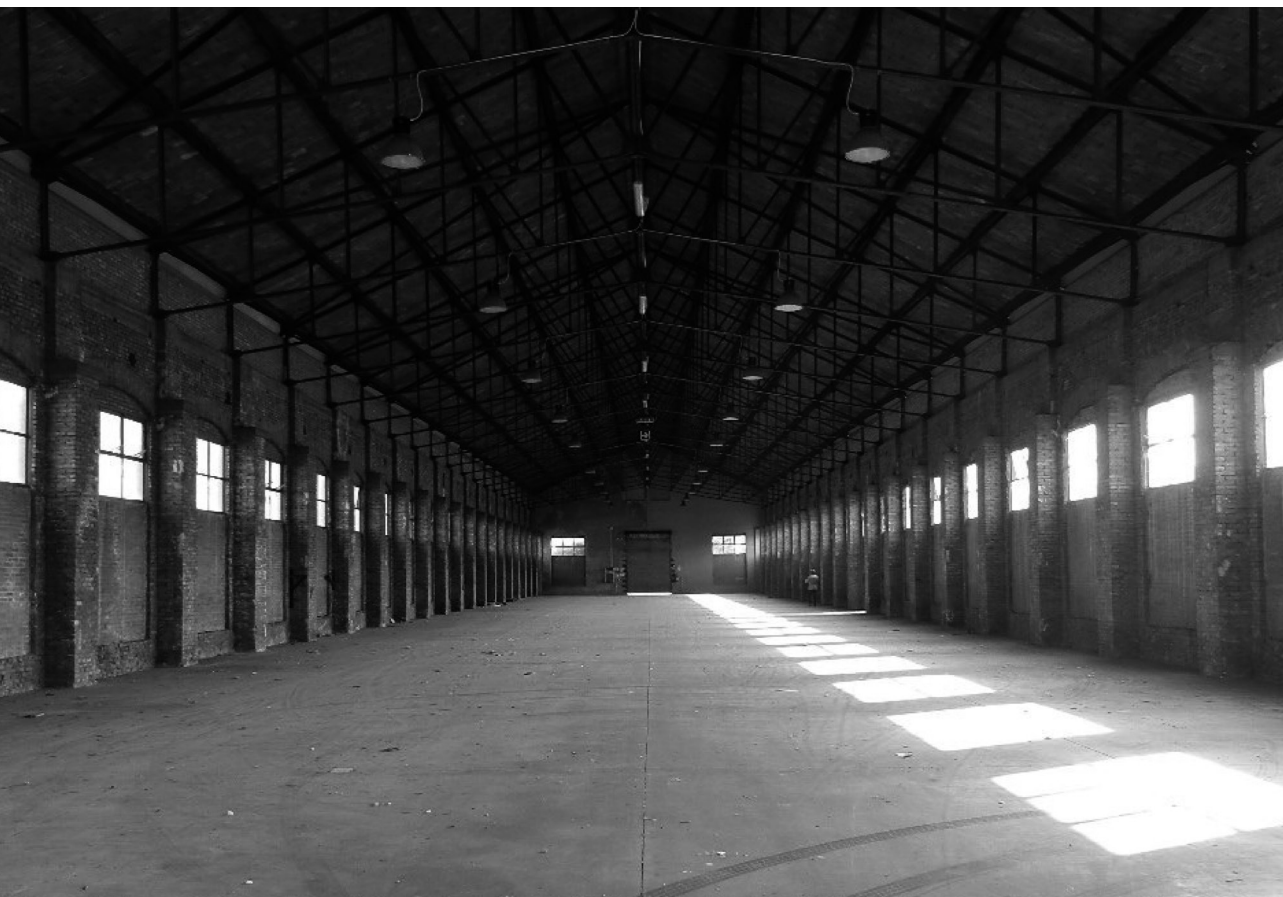
Fig. 2 – Ex scalo merci Ravone, Bologna. La prospettiva interna di un magazzino abbandonato esprime efficacemente il suo potenziale a conseguire risultati inediti. Per effetto della crisi finanziaria la valorizzazione dell'intera area non è mai iniziata, condannando gli immobili a precipitare in un provocatorio paesaggio di rovine. Noncurante dell'insussistenza delle condizioni al contorno, nel 2015 il Piano Operativo Comunale ha legittimato il destino del comparto a diventare un quartiere urbano ad alta densità.