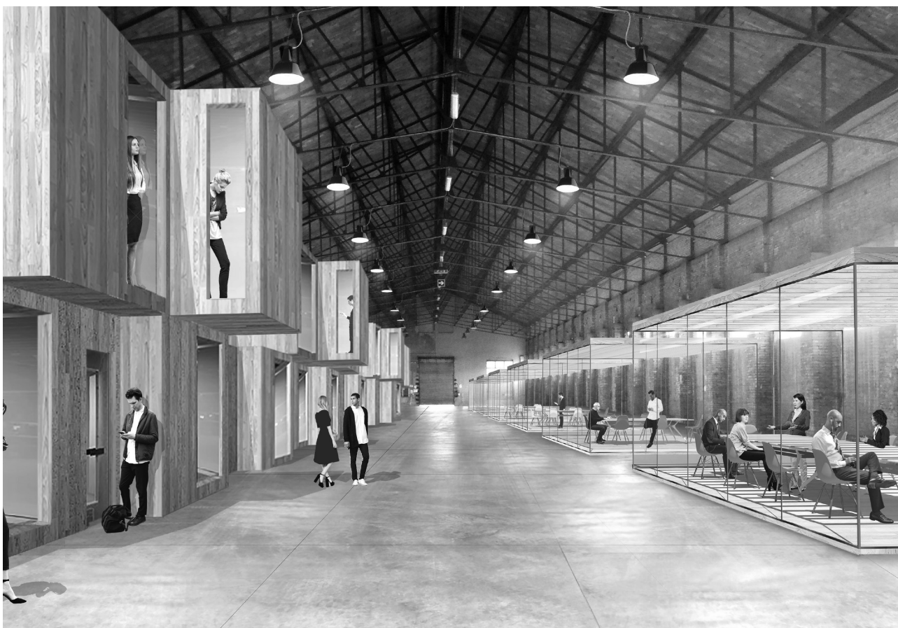
Fig. 3 – Ex scalo merci Ravone, Bologna. La riattivazione degli spazi con usi temporanei, affermando la funzione sperimentale dell'architettura intesa come prassi, può contribuire a prefigurare scenari alternativi, conformandoli alle reali esigenze della città e suggerendo orizzonti di opportunità che la logica del Piano non è strutturalmente in grado di concepire. Superate le iniziali resistenze della politica, che confermano l'alleanza con le leggi della finanza, l'area è finalmente pronta

oggi per un progetto sperimentale di innovazione socio-economica, voluto da Comune e Regione Emilia-Romagna come caso pilota di rigenerazione urbana. Committente FS Sistemi Urbani; Progetto: Studio PERFORMA A+U.