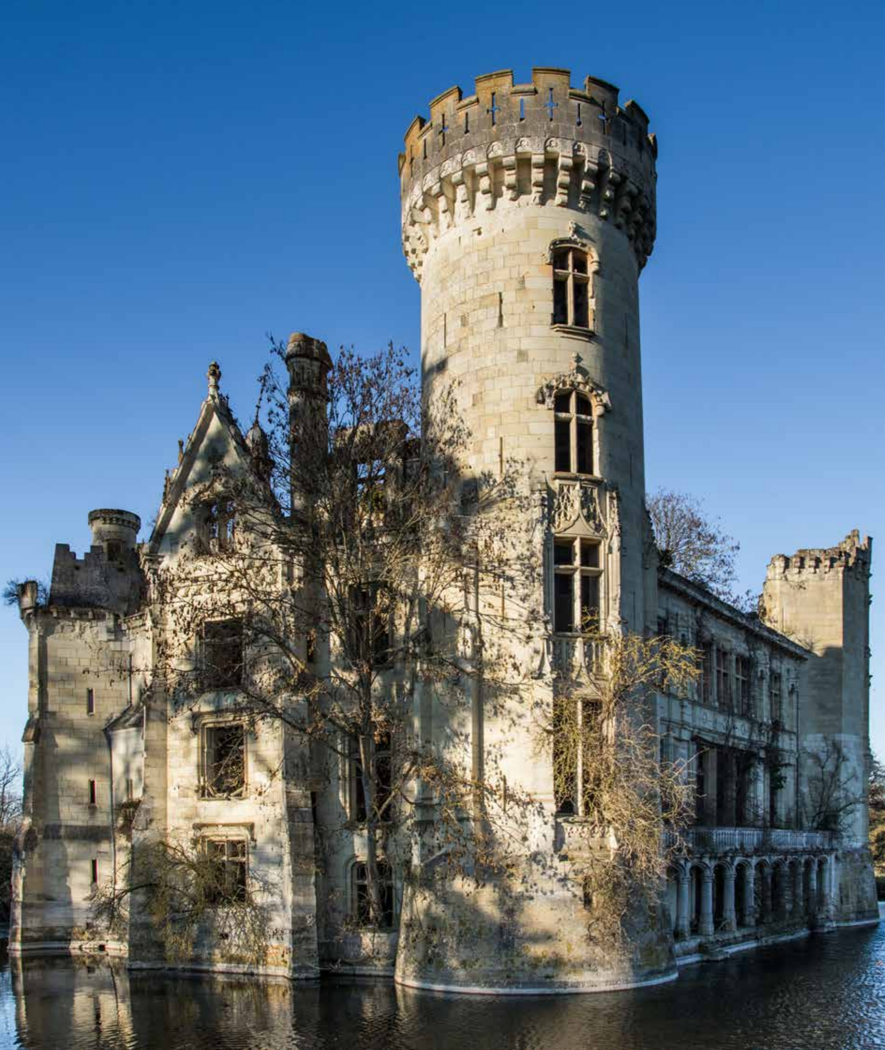
La torre principale del castello