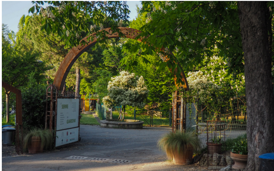
Figura 1.3. Le Serre dei Giardini Margherita: vista dall'interno.