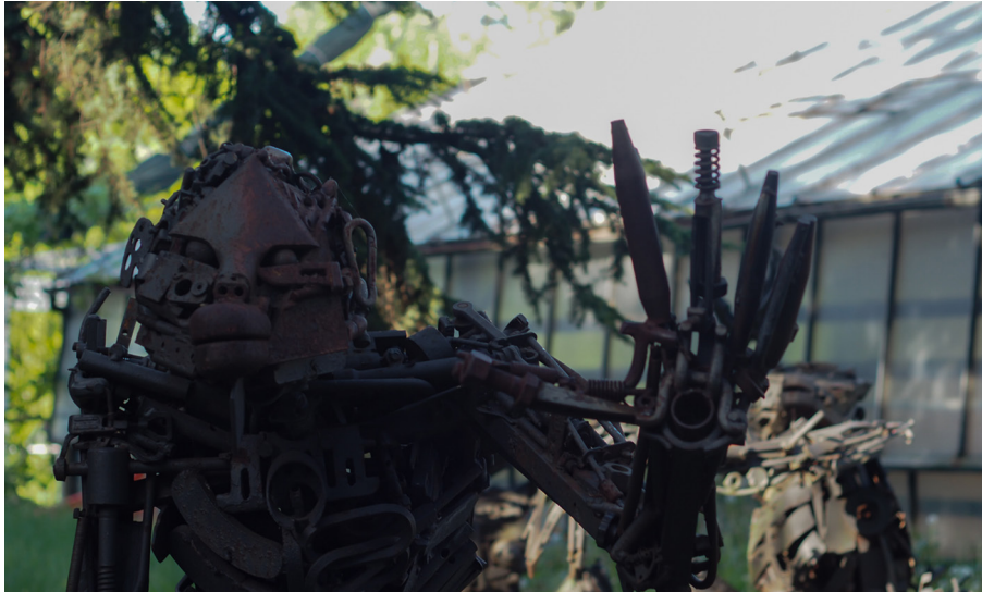
Figura 3.1. Analisi biomatrico-sonora: Spazio-Mutoidi

dimensione urbana pur trovandosi, di fatto, nella “quasi-campagna”.