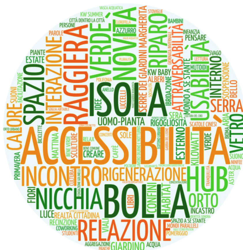
Figura. 4.1. Le Serre dei Giardini: una mappatura grafica dello spazio, tra accessibilità, effetti emersi e ricorsività semiotiche.