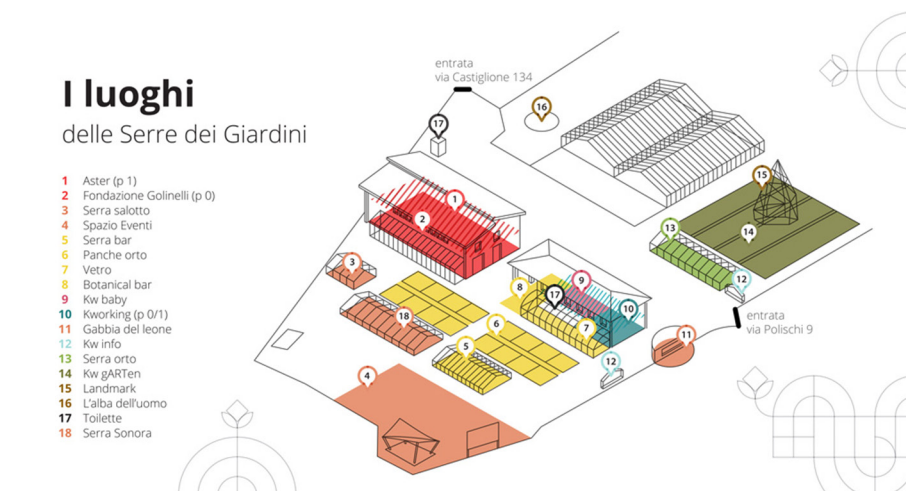
Figura 4.3. I luoghi delle Serre dei Giardini Margherita.

le logiche di gestione del poter-fare, unitamente all’impatto che i processi e le pratiche hanno su avventori e cittadinanza 11 . Kilowatt è stato riconosciuto come “realtà liquida”, a cui sono legate non solo le pratiche lavorative in relazione allo spazio, ma anche le pratiche del “pensare” e del “creare”. Parlare di “realtà liquida” risulta una formula efficace per rendere conto del dialogo – inteso come logica di valorizzazione del sapere – delle forme di collaborazione e delle logiche di ibridazione tra le comunità delle Serre, i lavoratori del co-working e i gestori del bistrot.