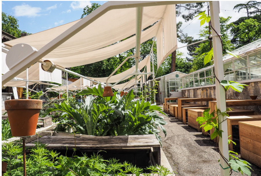
Figura. 4.2. Analisi biomatico-semiotica: KW Piazzale-Ortopanche

gimento di obiettivi comuni e/o individuali. Il co-working è versatilità, una delle possibili declinazioni in positivo della flessibilità. Il termine viene spesso affiancato a formule utili a spiegare il generale ripensamento che la dimensione lavorativa contemporanea attraversa, relativamente alla trasformazione dei modelli di lavoro.