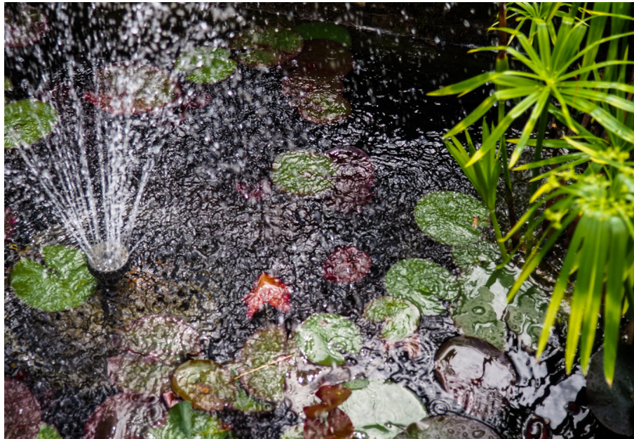
Figura. 3.2. Analisi biomatrico-sonora: Spazio-Vasca acquatica

tipata o archetipica all'interno dell'individuo. Una seconda analisi tiene conto del suono d'acqua, ma lo contestualizza nella sua micro articolazione, in quella che è definibile come percorso dell'acqua all'interno della vasca e attraverso le foglie del giglio acquatico e delle ninfee.