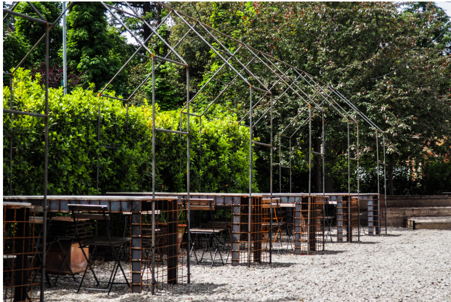
Figura 4.4. Analisi biomatrico-semiotica: KWPIazzale-Ortopanche

La serra è un dispositivo semiotico dove l'effetto antropico dell'uomo sul mondo vegetale si esplica e si rende manifesto, attraverso azioni e pratiche di controllo delle trasformazioni del verde rispetto alle variabili atmosferico-climatiche.