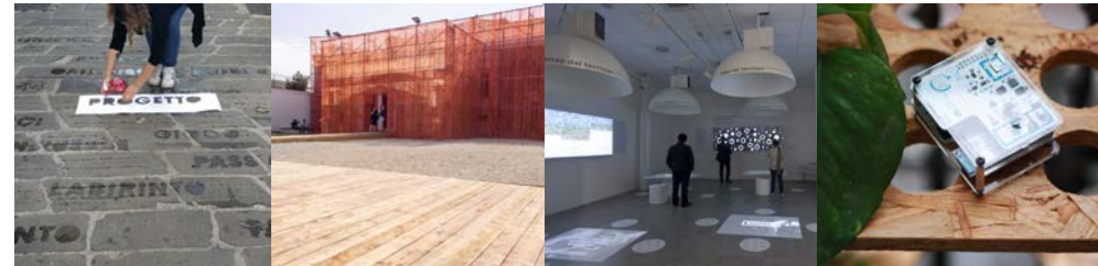
In copertina Km 5.8 NLD Workshop: alla riscoperta della ferula communis. Esempi di lavorazioni