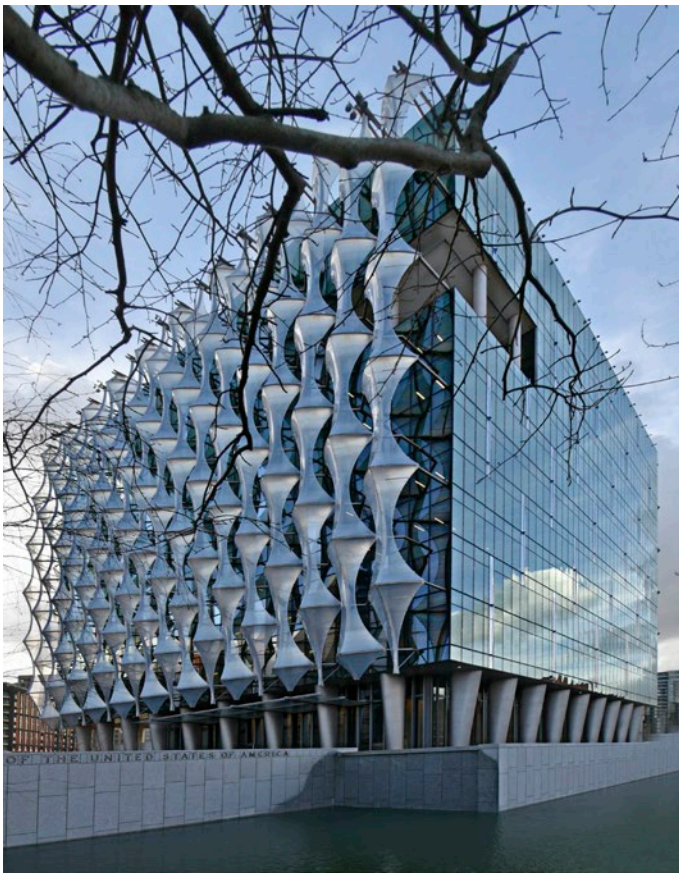
06 | Ambasciata degli Stati Uniti d'America, Londra, US Embassy, London