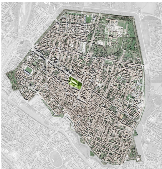
Figura 2 | Impianto di compostaggio nel centro storico.

All'interno di questa ricerca si è studiata in particolare la filiera del rifiuto organico, con la prospettiva di poter replicare in futuro lo stesso ragionamento nel campo delle filiere merceologiche riciclabili in maniera non industriale, come ad esempio la carta e la plastica.