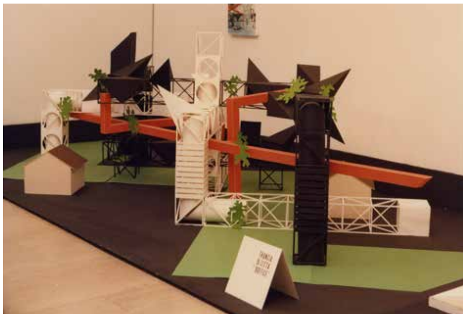
Mart, Archivio del '900 – Fondo Salvotti

ASSOCIAZIONE NAZIONALE ARCHIVI ARCHITETTURA CONTEMPORANEA • BOLLETTINO N° 22