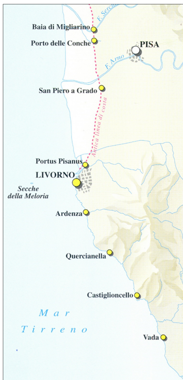
Fig. 3: Sistema portuale a più scali per lo sbocco al mare di Pisa.

Del pari un gruppo di testimonianze letterarie latine danno indicazioni su una serie di insediamenti lungo la costa, che verosimilmente dovevano marcare quel percorso costiero, ipotizzato per il periodo preromano, che dal porto di Vada andava a Pisa. In particolare, se nessuna informazione viene dal passo relativo ai Tirreni del periplo attribuito a Scilace di Carina, dove non si fa cenno, nel testo tradito, né a fiumi né a porti né a promontori, diversamente a quanto per lo più si legge nel resto dell'opera, l' Itinerarium Maritimum , un testo degli inizi del III secolo, segnala, per l'area pisana, Portus Pisanus e un approdo alla foce dell'Arno ( Itin.Marit. , 501). La Tabula Peutingeriana segnala lungo la costa tra la foce del Fine e Pisa solo le positiones di Piscinae e Turrita , indicazione che ritorna anche nella Cosmographia dell'Anonimo Ravennate e nei Geographica di Guido, entrambi in due luoghi paralleli relativi allo stesso percorso. Altre informazioni possono ricavarsi dal lungo passo del De reditu suo di Claudio