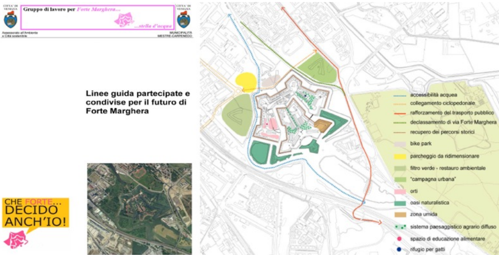
3: La copertina delle Linee guida elaborate dal GdLFM e una planimetria delle proposte avanzate nel corso del processo partecipativo, relativa all'accessibilità e all'uso degli spazi aperti [GdLFM 2013].

A partire da questo esito si sono avviati i tavoli tecnici di confronto creativo, organizzati per temi: dall'accessibilità e dalle relazioni del Forte con il contesto urbano agli usi degli spazi, alle modalità, tecniche e costi nel recupero, e infine ai criteri di finanziamento e gestione. Il confronto nei tavoli tematici ha visto impegnati molti cittadini, alcuni dei quali non avevano partecipato all'OST, ma erano stati richiamati ai tavoli dal successo dell'iniziativa, portandovi interessi e competenze che potevano contribuire alla definizione del progetto. Pur con momenti di difficoltà, anche per la presenza in alcuni casi di partecipanti poco inclini a rimettere in discussione le proprie idee di partenza, si sono comunque cercate e individuate soluzioni condivise, anche per gli argomenti oggetto di contrasti. Il lavoro finale di riscrittura delle "Linee guida partecipate e condivise per il futuro di Forte Marghera" è stato poi svolto da alcuni componenti del GdLFM, e verificato/emendato in occasione di un'assemblea plenaria, alla quale hanno contribuito i partecipanti a tutti i diversi tavoli.