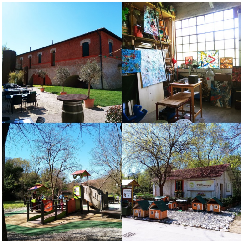
5: Alcune delle aree recuperate e i loro usi: il Centro di documentazione sulle architetture fortificate, nell'edificio che ingloba un ponte cinquecentesco; residenze d'artista presso "Officina 32"; "Ugualeland", primo parco giochi accessibile e inclusivo della provincia di Venezia; l'oasi felina "I mici del Forte".

Ma l'esito più importante del lavoro svolto da cittadini e associazioni è il fatto che oggi appare definitivamente sventato il rischio della privatizzazione e la loro iniziativa costituisce ancora oggi un valido riferimento.