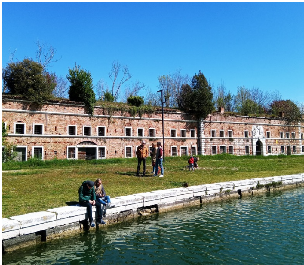
2: Una delle "casermette francesi", edifici di maggior pregio affacciati sulla darsena centrale del Forte. Appare chiaro il degrado cui ancora fino al 2020 è necessario porre rimedio, nonostante la possibilità di fruire gli spazi pubblici vicini.

Al contempo, e per contro, un gruppo di quattordici associazioni del territorio si autorganizza per realizzare la prima proposta organica e complessiva per il riutilizzo e la valorizzazione del Forte: il Laboratorio di progettazione collettiva per Forte Marghera presenta il progetto «Sprivatizzare i beni pubblici: per una progettazione e gestione partecipata dei beni comuni. Per un Forte Aperto, Solidale e Sostenibile» (marzo 2008).