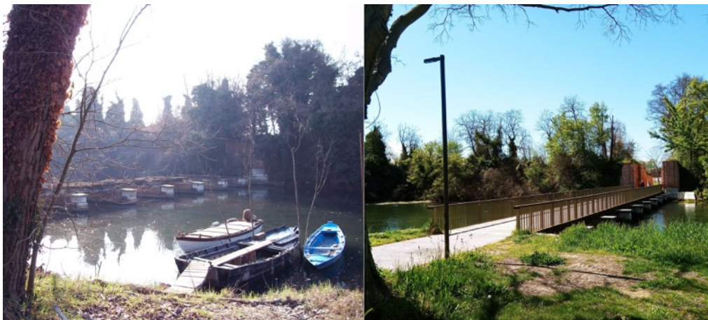
4: Confronto tra lo stato di fatto nel 2012 e la realizzata riqualificazione degli spazi pubblici: uno dei ponti tra zona esterna e ridotto centrale del Forte.

Permangono però alcune criticità relative alla gestione, ai rapporti tra decisori e shareholders , che la costruzione di un progetto partecipato “dal basso” raramente scalfisce. In questi casi non resta che continuare a monitorare e informare, tenendo viva la capacità di molti di rendersi responsabili di sempre nuovi, e adeguati alle diverse situazioni, percorsi di difesa di un bene comune.