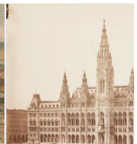
Wien Museum, Inve