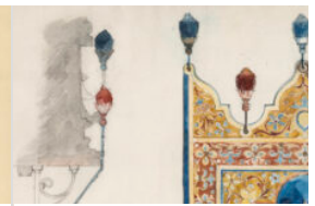
Wien Museum, Inver