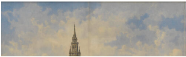
Wien Museum, Inventarnummer HMW 60293